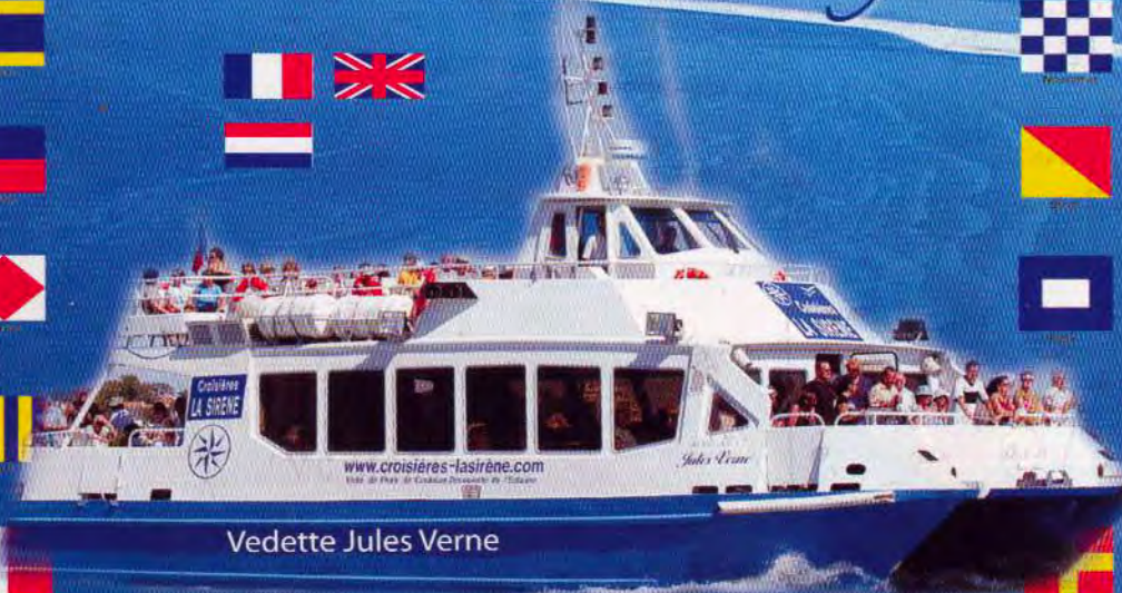
Vedette Jules Verne